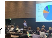
修了生講演会&ホームカミングデー

そのほか、毎年「修了生講演会」を開催し、本学で大学院生として学んでいる修了生と日本の企業や地方自治体などで働いている修了生を招いて、在校生に修了後の進路についての情報を提供しています。また、2023年から同日に「ホームカミングデー」を開催し、日本で進学・就職している修了生が年1回集まり交流する日も設けています。