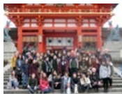
伏見稲荷大社見学

2023年：留学生数 2,781人、日研生 55人 2022年：留学生数 2,590人、日研生 63人 2021年：留学生数 2,612人、日研生 57人